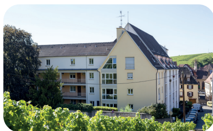
RIBEAUVILLE, 7 rue Saltzmann