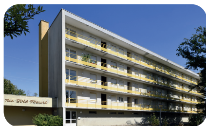
RICHWILLER, 12 rue de Ferrette

Cinq projets portés par HHA ont ainsi été sélectionnés par la Collectivité européenne d'Alsace et la CNSA (Caisse Nationale de Solidarité pour l'Autonomie) dont deux ont été lancés début 2023 :